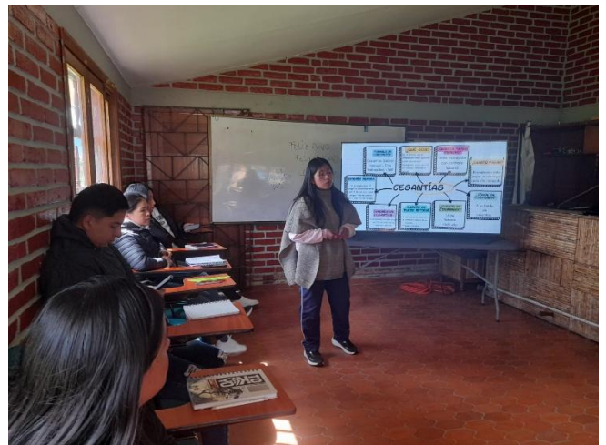
Zúñiga, S. (2025) formación técnico de contabilización – Silvia , [Fotografía]. Elaboración Propia