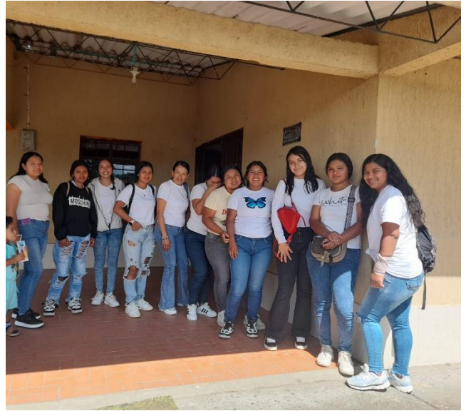
Zúñiga, S. (2025) formación grupo de cuidado estético , municipio de Popayán [Fotografía]. Elaboración Propia